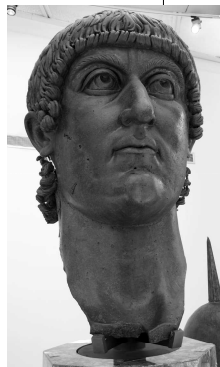
コンスタンティヌス